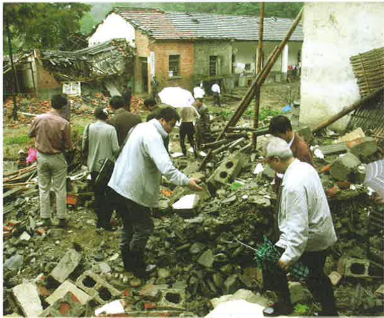
考察組成員們站在被毀的校舍前，洪災過後學校幾乎被夷為平地。

考察團於21日當天由澳門經廣州白雲機場飛抵安徽駱崗機場。第二天清早，天還沒亮就出發，經過兩個多小時的顛簸路程，到達了貧瘠的安徽省六安市裕安區西河口鄉洪河鎮，沿山洪暴發沖擊的路徑考察災情，因公路已被洪水沖毀，考察車隊只能在河床亂石堆上搖晃而行。三個多小時涉水攀山的途中所見盡是一片碎瓦頹壁的廢墟、塌毀的河堤、沖毀的小學和僅存的危房，所見的農作物均為水浸泡而壞掉，災民大半年的辛苦顆粒無收，剛建成的柏油公路和橋樑，亦在洪災中遭到無情的摧毀。