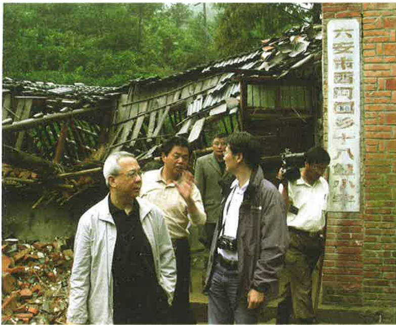
考察團成員視察十八盤小學損壞情況。